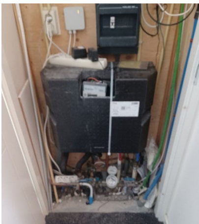
Stekkerdoos open onder de warmte-afleverset

➤ Onze monteurs zijn allemaal NEN gecertificeerd. Zij plaatsen de gateway voor de slimme warmtemeter aan de achterwand en een eventuele wandcontactdoos op een zo veilig mogelijke plaats. Daarmee zijn de risico's voor jou als klant tot een minimum beperkt.